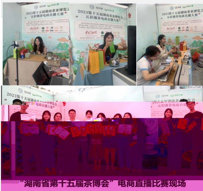
“湖南省第十五届茶博会”电商直播比赛现场